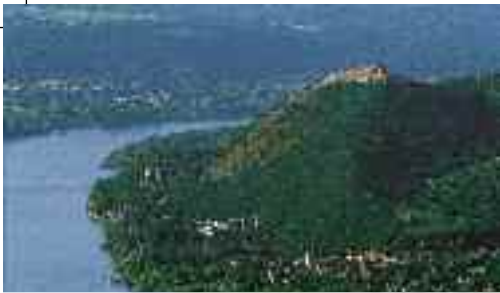
Duna-Ipoly Nemzeti Park