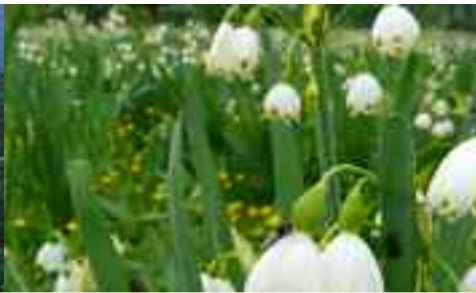
Dunajské luhy Természeti Terület