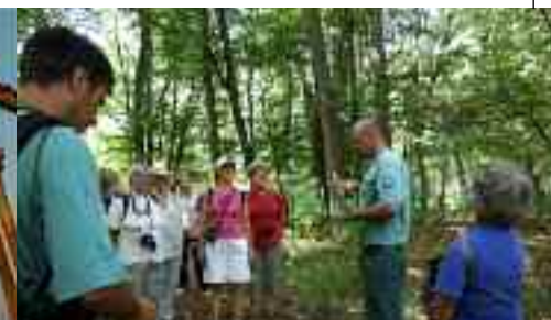
Duna-Dráva Nemzeti Park