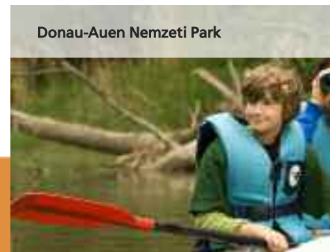
Donau-Auen Nemzeti Park