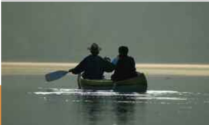
A hálózat egyik célja az ökológiai szempontból elfogadható evezős turizmus fejlesztése