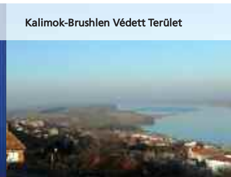
Kalimok-Brushlen Védett Terület