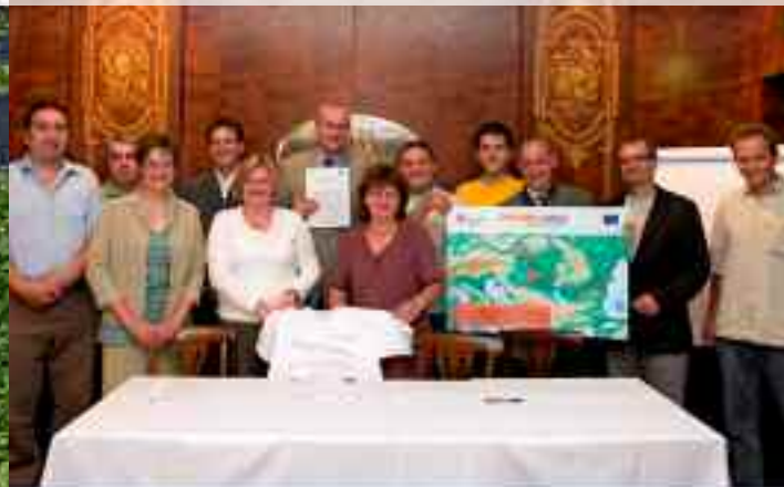
2009. június: A Bécsi Nyilatkozat aláírásával létrejött a Duna menti Védett Területek Hálózata