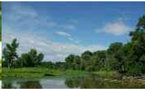
Záhorie Természeti Terület