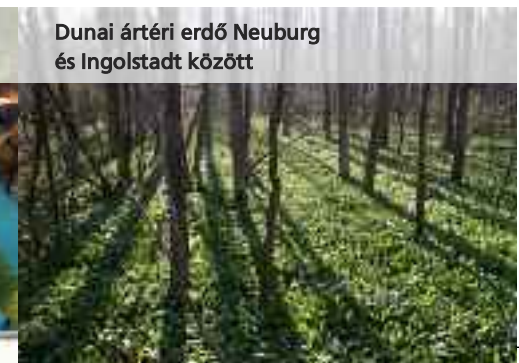
Dunai ártéri erdő Neuburg és Ingolstadt között