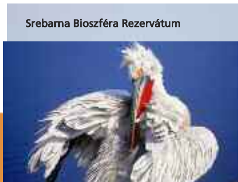
Srebarna Bioszféra Rezervátum