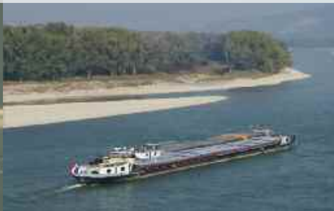
Közös stratégiákat alakítunk ki a természetvédelem és a hajózás konfliktusainak kezelésére.