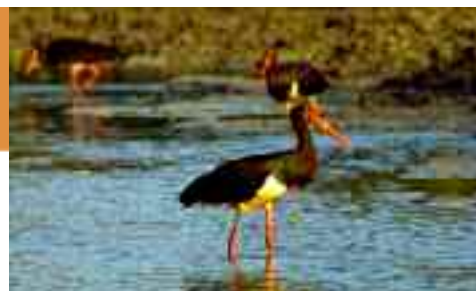
Gornje Podunavlje (Felső-Dunamellék) Természeti Rezervátum

Kalimok–Brushlen Védett Terület (civil szervezet), www.kalimok.eu