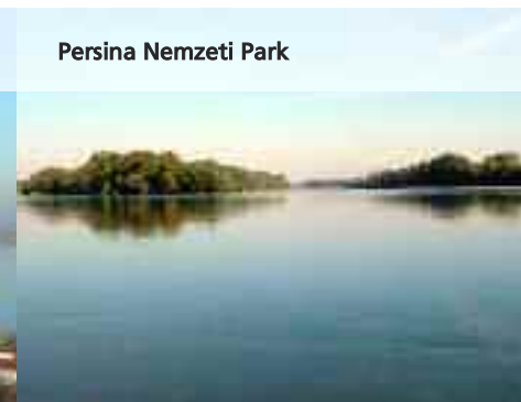
Persina Nemzeti Park