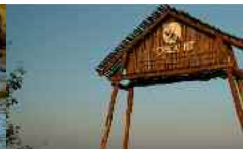
Kopácsi-rét Nemzeti Park