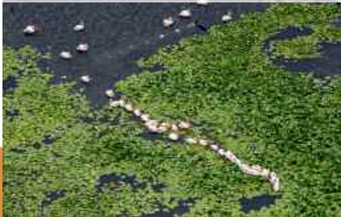
Pelikánok a Duna-deltában