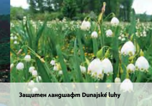
Защитен ландшафт Dunajské luhy