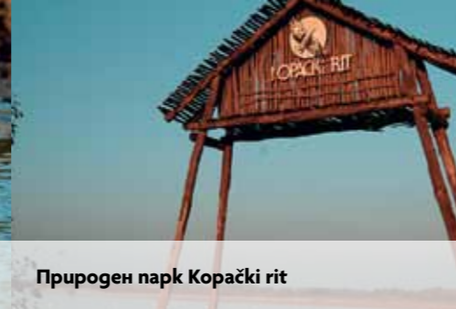
Природен парк Kopački rit