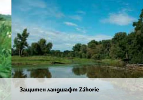
Защитен ландшафт Záhorie

риби. Големото разнообразие на местообитанията обуславя високата степен на биоразнообразието в района, например слабо засолен крайречни пасища.