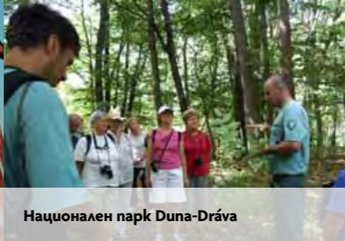
Национален парк Duna-Dráva