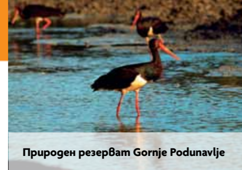
Природен резерват Gornje Podunavlje

Тази защитена местност е създадена с цел опазване на значими територии по поречието на Дунав и крайречни заливни гори, а също и на влажните зони, образувани от бившите блатата Калимок и Бръшлен. Местността е от важно значение за размножаването на редица застрашени видове