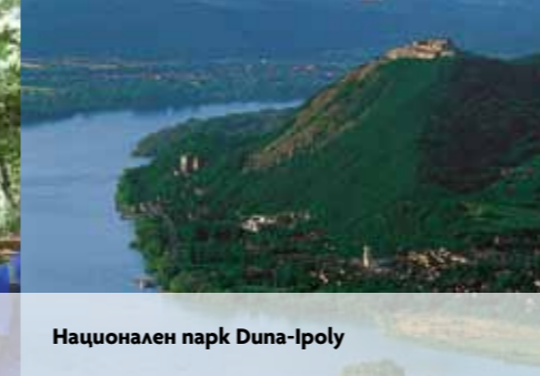
Национален парк Duna-Ipoly